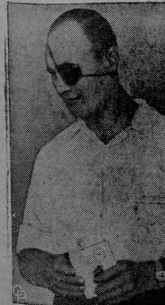
GANANDO PODER.—El Mayor General Moshe Dayan (abajo), ex Jefe del Estado Mayor de Israel y probable nuevo Ministro de Agricultura, deposita su voto en Tel Aviv. El Partido Mapai, del Premier David Ben Gurion (arriba) ganó 6 nuevos escaños con un total de 46 de los 120. El Partido acumuló la mayor votación.