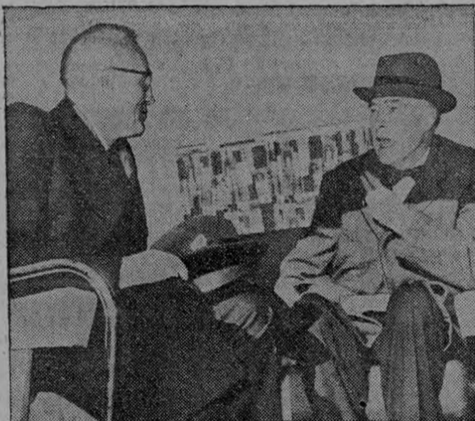
CANADA Y ESTADOS UNIDOS CONFIRMAN EL Secretario de Estado, Christian A. Herter conferencia en un helicóptero con Harold C. Green, el Secretario de Estado para Asuntos Exteriores de Canadá, durante un vuelo de Washington a Camp David, en Maryland. Oficiales del Gabinete de los Estados Unidos y Canadá conferenciaron en la casa de campo presidencial para discutir la defensa conjunta y sellar los gastos militares.

Por ley se estableció la obligación de que toda pieza postal que se entregue al Correo en el mes de diciembre deba llevar, a más de las estampillas correspondientes, un sello adicional, especial, con valor de cinco céntimos de la suma total que se logre parte es para allegar fondos a favor de la Ciudad de los Niños. Debe quedar debidamente aclarado para el público que se trata de una estampilla especial que debe agregarse a la correspondencia. No podrá ser un sello corriente de cinco céntimos, sino uno especial, ya que de hacerse así el interesado perderá tal valor y deberá siempre pegar un sello de los que dejamos citados. Esas estampillas deberán agregarse solamente en el mes de diciembre de cada año, según lo establece la ley respectiva. El año anterior, nos enteramos, se vendieron sellos de esta clase por un valor de un millón setecientos mil colones. De esa suma le quedó una cantidad muy apreciable al fondo para la Ciudad de los Niños. Este año, desde el primero de Diciembre, se exigirá ese sello adicional.